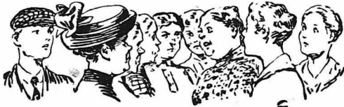
Η ΜΝΗΜΗ ΤΟΥ Μ. ΝΑΠΟΛΕΟΝΤΟΣ

Σε κάποιο γεύμα ο Μέγας Ναπολέων, αφηγηόμενος μιά παλιά στρατιωτική του υποχρέωση, ανέφερε λεπτομερώς τους αριθμούς όλων των ταγμάτων που είχαν λάβει μέρος σ' αυτήν. Η κυρία Μπερτάν τότε, παραξενευθείσα με την καταπληκτική μνήμη του, έκωφε τον Αυτοκράτορα και τον ερώτησε πώς ήταν δυνατόν, ύστερ' από τόσα χρόνια, να θυμάται όλους αυτούς τους αριθμούς.