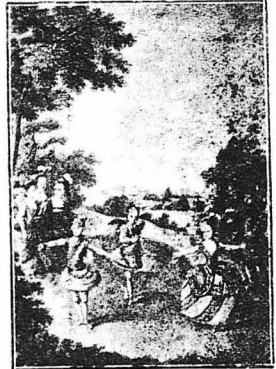
Η άρχιδουκισσα Μαρία Άντουανέττα σ' ένα χωρι που έδδθη στην Αλή της Βιέννης.

Φαντασθήτε τώρα, έχι πιά την πλήρη της έθιμοτυπίας μόνο, την άδιαφορία της ομογενείας, την ήθικη έγκατάλειψη, μα τα χειρότερα βασανιστήρια που μπορούσαν να έπιβληθούσαν σ' έναν άνθρωπο. Διαβαζόντες κωμικά φορέ στις έφημεριδές ότι ένα δυστυχισμένο παιδι πέθανε από τα μαρτύρια που τό ύπέβαλαν οι γονείς του, οι όποιοι τό