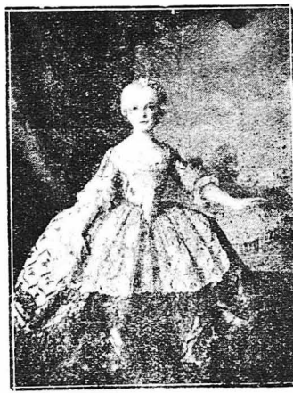
ΠΟΡΤΡΑΙΤΟ ΑΓΝΩΣΤΟΥ ΜΙΚΡΑΣ ΠΡΙΓΚΗΠΙΣΣΗΣ, (έργο του περιφημού ζωγράφου Νατιέ).— Όπως βλέπεται στην εικόνα αυτή, η έθιμοτυπία έπιβαλλε στις μικρές πριγκηπισσες να νύνονται σε μεγάλες κυρίες, πράγμα που τις έμπόδιζε να έχουν έλευθερία κινήσεων και,φυσικά,δυσκόλευε την άνάπτυξηται.