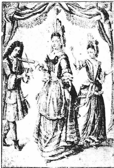
ΤΟ ΜΑΘΗΜΑ ΤΟΥ ΧΟΡΟΥ (Γκροβόρα του Μπουρά).—Το μάθημα του χορού ήταν μία από τις σπάνιες διακοσμήσεις των μικρών πριγκηπισσών. Μία και σ' αυτό ακόμη ήταν ύποχρεωμένες να συμπεριφέρονται σαν καλόγριες!

δυνατο. Ποτέ τα δάκρυα δεν έθόλωσαν τα φρύατα της μάτις, ποτέ η παραμικρή στενωχάρια δεν έκανε να κατασουφιάσει το χροιοκίεμο της πρόσωπο. Η ιδιοτροπίας της έπεβαλλαντο ως νόμος, η γουβερανάτα της; της έφορετο με σεβασμό και αυτός ο ίδιος ο πατέρας άσφαλλος δεν έμάλθα ε'σώτε ένα τέτοιο πλάσμα ποδ ήταν λεπτό κ' εύγενικό σάν λουλούδι!