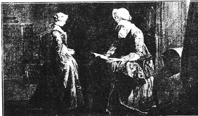
Η ΚΛΑΗ ΆΝΑΓΡΟΦΗ, (Πινάξ του Σαρτιν).— Έν αντίθεσι προς τα μαρτύρια που ύφιστατο η μικρές πριγκηπισσες κατά τον 17ον και 18ον αιώνα, τα κορίτσια των αστικων οικογενειών, όπως δείχνει η εικόνα μας, άνερίφοντο με γλυκύτητα και καλοσύνη.

Όταν ο Γουλιέλμος ήταν θυμωμένος ύποχρόεως τα παιδιά του να μένουν μέσα στην κάμαρη του και για να του περάση ο θυμός τους πενοόσε κανακέφαλα, δ.τι εύρισκε μπροστά τον, πιάτα, ποτήρια, κομψοτεχνήματα κτλ. Άλλες φορές πάλι κυνηγούσε τη Γουλιέλμίνη χευπάντας την συνελχώς με τη μαχουόνα στην πλάτη και σπρώχνοντας την άπάνω στα διάφορα έπιπλα του δωματίου. Έπίσης κ' η γκουβερνάττα έδωγε διαρκώς τή στωχη πριγκηποκούλα. Μία φορά μάλιστα δέροντες την την έσπρωξε και την έφριξε από μία σκάλα και λίγο έλειψε να σπύση τα χέρια και τα πόδια της. Έτσι, από λίγες μέρες της πέταξε καταπέφαιλα ένα κανεβαλιό που λίγο έλειψε να την άφρηση στο υπόπο.