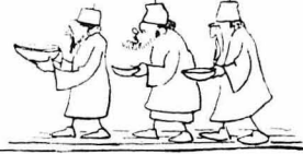
Κούλουμα στο Μοναστήρι άδειασέ το, τό ποτήρι.

Ήσκυφεν ο Νικολάκης τι να ιδή ! Μέσα σέ παχύν χυλόν, έβραζαν φασόλια λευκά και νόστιμα, με όλοστρώγγυλας και παχουλές μαφρες δολιχές, πού φανίνονσαν, μέσα στού κόχλου τού άνακάτωμα, σάν μελανοι καλόγηροι, να στριφογυρίζουν και να χοροπηθούν, και να χορεύουν με λευκόσαρκας κοπέλλες !