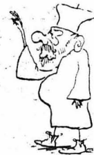
Και να λοιπόν γιατί έπαλογήρε ο Νικολάκης τή Λαθαρή Δευτέρα.