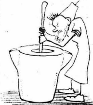
Στά μεγάλα τού μοναστηριου καθάνα.

Άν ήξευρα πατά τι τού νιότανε ο Νικολάκης. Κάθως μαζός τους κι' άρχισε τό γλέντι. Άδός έάπινε τού κρασί, ή θά καταπίνετο όλόκληρο, μέσα στήν μαύρη έκείνη κρασοτρικυμία !... σκεφτόταν έλεπόντες τις γεμάτες κανάτες... Κ' έπινε, έπινε ός ποθίπσε κάτω έπρός. Όταν συνήλθε βρέθηκε σ' ένα κα-