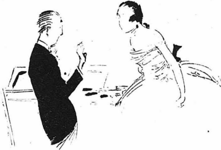
- Μου προέβεινε φίλικη !

Χαρίς να θέλη τότε ό ζωγράφος τινάχτηκε ένάνα, πήρε ένα άλλο μουσαμά και άρχισε να ζωγραφίζει τώρα από μνήμη; άπ' τό κομμάτι εκό μωρημέρι με τόση όρθή, όποτε τό έργο του είχε τελειώσει; πειά