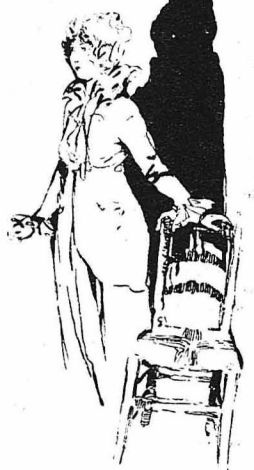
Κύτταξε προσεκτικά τήν εικόνα.