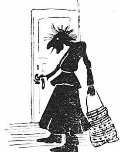
Ένας μαύρος άνθρωπος άνοιξε την πόρτα.

Τότε ειπε και ή Ντίνενα, σφρεφομένη προς τόν Ντίνο: Ποδαι τά λόγια πουλέγες κι' οι θρκοι σου οι τόσοι, κι' έγω ή τρελλή, σε πιστευα, γιατί δέν ειγα γνάσι.