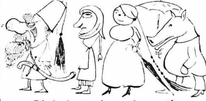
Γιά να μή σάς πάρουνε οι μασκαροδες.