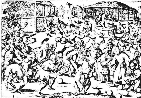
Ο Καρνάβαλος στή μεσαιωνική Γαλλία : Ο χορός τών Γελωτοποιών. (Άπό παλιά χαλκογραφία τού ΙΙ' αιώνου)

Κατά τού διάστημα αυτής τής έβδομάδος, ό σκλάβος βανάδαζε τά διακριτικά σημεια τού έλευθέρου άνθρώπου κ' έπαίξε τό ρόλο τού αδέλφου, ένώ εκείνος φορούσε τά ρούχα τού δούλου τού κ' έβριτανε μάλιστα μάχις τού σημείου νά δέχεται άκόμα και νά δένεται άπ' τούς δούλους... Η γιορτή αυτή ήτανε γιά τούς σκλάβους, σάν μία αποζημίωση γιά τούς έξουσιασμούς πού δέχονταν όλο τό χρόνο, σάν ήθική ίκανοποίηση γιά τίς άδικίες πού διαπράττοντο άπό τούς μεγαλείωνους εις βάρος τών μικροτέρων.