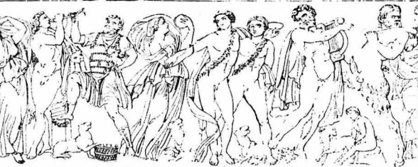
Οί αρχαίες Βαχχιδες

Τό σούθημα τών διασκοδίσων, κατά τόν Καρνάβαλο, τό είχαν στήν Γαλλία οί γελωτοποιοί. Οί άνθρωποι αυτοί λεηλατούσαν τίς εκκλησίες, έπαίξαν ζάρια πάνω στήν άγία τράπεζα, έπιναν κρασί μέσα στό άγιο διακοπήρη, ποδοπατούσαν τά ιερά λείψανα πού είχε τότε κά-