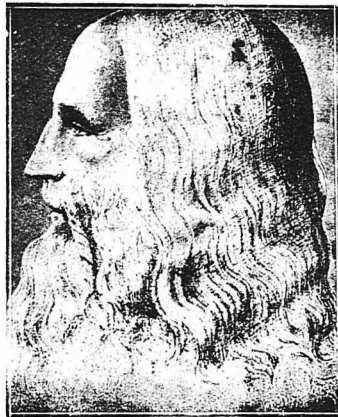
Αυτόπροσωπογραφία του Λεονάρδου ντά Βίντσι.

Ο ντά Βίντσι άνέλαθε να χαράξη στη Σολένη