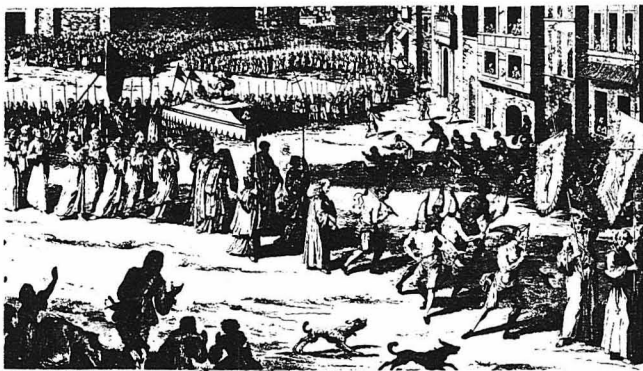
Μια λιτανεία «μαστιγούμενων», κατά την εποχή του «συνδεδμού» των καθολικών».

Στην άρχή εξαφανήσμε στη Γαλλία, ίδιος στις έπαρχίες του Βορρά. Τά πέσινα λουριά είχαν άντικατασταθή πλέον με τά καυνοσταθή, όπλισμένα στην άκμή με μικρές σιδερένιες άρπασες, για να ξεσκίζουν τις σάρκες. Ύψηρχαν δε για τους μαστιγούμενους δύο είδων μετάνοια: Η κοιν η μετάνοια, κατά την όποια άντρες και γυναίκες, με σκισπασμένο τό πρόσσπο και τό κεφάλι και με γυρνώντας τους ώμους και τά νεφρά, άλληλομαστιγώνονταν άναμεικτά τους μέχρι αίματος! Ή άλλη μετάνοια έλεγαν ά π ο μ κ ή: Κατ' αυτήν κάθε μαστιγούμενος έλάμβανε από τό χέρι του άρχηγού της τελετής έναν άριθμό χτυπημάτων με τό καυνοσταθί. Ο άριθμός αυ-