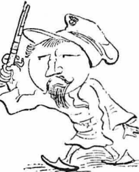
— Μπάμ !..