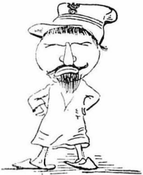
Αυτόν που τον έβρεμε ή Τουρκιά...