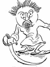
Κι' έβουε τ'ά έξωρος