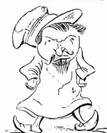
Ποιός έξόντως, παρακαλώ, τήν ληστειαν στα 'Αποκόρωνα;

— Μ' αυτό δέν ύποφέρεται πικ'ά ! Αυτό 'λέγεται άντίστασις κατά τής έξουσίας, σ'αέφτησε ο Σγουρομάλλης.