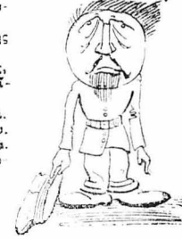
'Αρκετά μου βάλατε !

Σ'ά λίγες ήμέρες, ο Σγουρομάλλης εδικάζετο στο Πλημμελειοδικείο. Τόν είχε κηνώσει ή σπιτοκουκουρά του γιά τήν φθορά των επίλων τής !