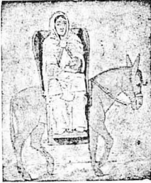
Η ΦΥΓΗ ΣΤΗΝ ΑΙΓΥΠΤΟ (όπως την απεικονίσθησε ένας γλύπτης του 10ου αιώνου). — Ο καλλιτέχνης στο έργο του αυτό έχει ντίσει την Παγαία Εως τις γυναίκες της εποχής του, οι οποίες ταξίδευαν πάντοτε σε άλογα ή γαϊδούρια, στηριγμένες σε μία άδρα με άρσιονατο.