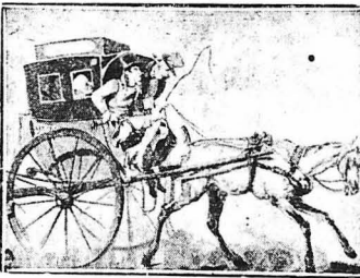
Μια γελιοκροατία τῶς ζωγράφου Βενέν, σαρνιόζουα τ' άμεία και τὰ ταξείδια της εποχής του 1820.

διέρχετα ένα κορό κινδύνους, τόσο εκ μέρους των σε ιχέλων τὴς φύσεως όσο και εκ μέρους των ανθρώπων.