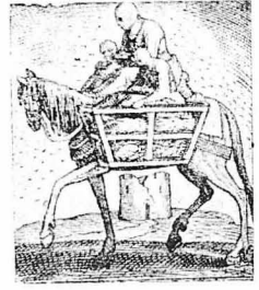
ΜΙΑ ΟΙΚΟΓΕΝΕΙΑ ΣΕ ΤΑΞΕΙΔΙΑ κατὰ τὸν 16ον αἰῶνα. (Παλιὰ λιθογραφία).

Γιὰ νὰ κατολαβετε πόσο ἐπισφαλῆ ἦταν τὰ ταξείδια και μέ- χως ἀκόμα τοῦ τέλους τοῦ περασμένου αἰῶνος, σὰς λέμε μονάχα πὸς σὲ κάθε σταθμὸ ἀμαξῶν ὑπῆρχε κρημασμένη και ἡ ἐξῆς εἰδο- ποίηση : «Εἰδοτοιοῦνται οἱ κ.κ. ταξιδιωταὶ νὰ μὴ ἀφήνουν τὸ δαλο ἀπ' τὸ χεῖρ κατὰ τὸ διά- στημα τοῦ ταξιδίου».