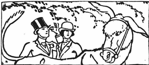
ΑΠΟ ΤΗΝ ΙΣΤΟΡΙΑ