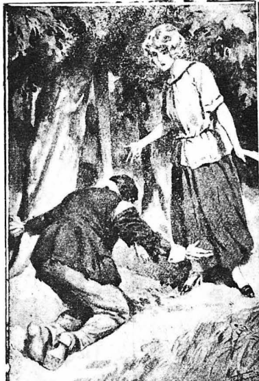
Ο Μπαλαό γονάτιος μπρός της...

— Μα κάντε γρήγορα !... έμουρμούρισε. Τόν άδήγησε κάτω και τόν έρπασε στο σαλόνι, όπου ο Πατριός ηδρε τα ίδια έπιπλα πού έστόλιζαν το σαλόνι του Σαιν-Μαρτέν. Μα κι' έδω ή ίδια άμέλεια, ή ίδια έλλειψη ενός λουλουδιού και κάθε