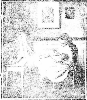
Η «ΚΟΥΚΛΑ». Πίναξ του Δάρρ.

Με ποιά αγάπη ή μικρή αυτή κινή περιποιείται, ναουρίζει και ντύνει την κοκλίδα της. Βλέπει κανείς στις φροντίδες της αυτές έλη τη σταγή μας άληφνης μητέρας!