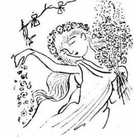
Ἐσκόριζε λουλούδια σὰν τὴν ἀνοίξει...