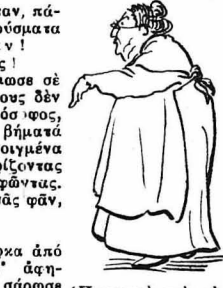
Ἡ γειτονιά τοῦ ἰ- μακάρει... Ἄπλα σὲ μιὰ θαρίλα...

Ροφοῦς, λιθῶνια σπαρταριστὰ καὶ ὀλόγγυρα φαγιριά, σῆμονες καὶ μαυρόφαρα, πέχους καὶ χάνους καὶ σκαρποῦς, γιὰ κόκκινο πιπερωτὸ ἐμπουραγέτο, σπάρκος καὶ σαγροῦς, γῶτες, λαυράκια κ' ἡ γοργάρα, μολ- δες, σαρδελιόμας καὶ κεφάλους, μό- νον ὁ Γώγολος, ἀπὸ τὸν πράσινο βυ- θὸ ἀνέσπερε καὶ μόνον αὐτὸς τὰ σα- φειρένια μυσικά τῆς θάλασσας ἐ- γνώριζε. Ἡ ἔβρασε τοὺς γόνους καὶ τὶς ἐποχές. Ἡ ἔβρασε τῆς θάλασσας τὰ μυσ- τικά καὶ τῆς θάλασσας τὰ μᾶτια. Στρεβίδια καὶ κωποσάντες κ' ἀχρη- δες κ' ἀχινούς μᾶτσε δσοὺς καὶ νὰ