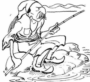
Τό γιάλο - γιάλο φαράκια κνηγῶ..