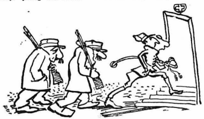
Έμπήσαν όλοι στό Νοσοκομείο...