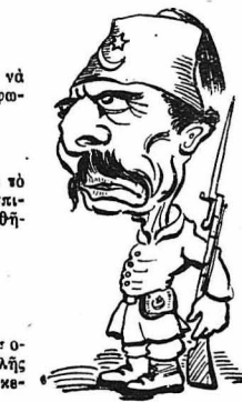
Οι Τούρκοι τού φλόγαν τού Μτιάνι.