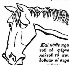
Και κάθε πρωί του τού φέρναν καίτοι τού πουλοσαν οι στρατιώτες...

Ο Γκολφάτος με την νέα διαταγή της άνωρηθήσασ ένόμισαν ότι και πάλιν συνεκάη και έπειδή κανείς δέν τον έπιστευσ, έσκέφθη ότι περισσότερες ύψησές; θά προεφεραν στην Θεσσαλονίκη μέναν, παρό παρακολουθών στην πολεμική κορείαν της την διλοχίαν.