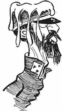
Άν έξρω μή μής φέρει και σαμπάνια, είπασ ο λοχαγέσων ύπολοχαγός...