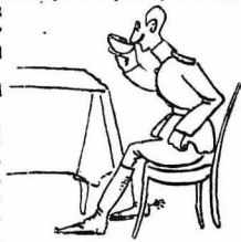
Έπηρεε τού τάξι του με τούς άξιωματικούς...