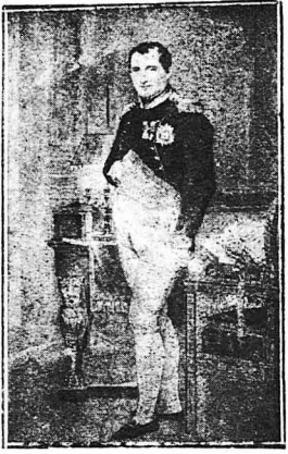
Ο ΝΑΠΟΛΕΩΝ ΣΤΟ ΓΡΑΦΕΙΟ ΤΟΥ (Πίναξ τού μεγάλου ζωγράφου Δαβίδ)

Τά μεσάνυχτα ήσαν ή όρα τού ύπνου τού Ναπολεόντος. Στις τρεις το πρωί ύπνοθεσε. Άφού ντυνόταν διευθυνοτόν στο γραφείο του, όπου ο γραμματέας του, ίδιοπο ήμνος από βροδύς τόν έπερμενε. Κατά τιν όρα αυτή ο Ναπολέων ύπέγραφε τά διάφορα έγγραφα. Στις πένες ή έγγρασία αυτή τελείωνε. Ο Ναπολέων έπαιρνε ένα μπανιό και πλάγιαζε πάλι ως τις έφρα.