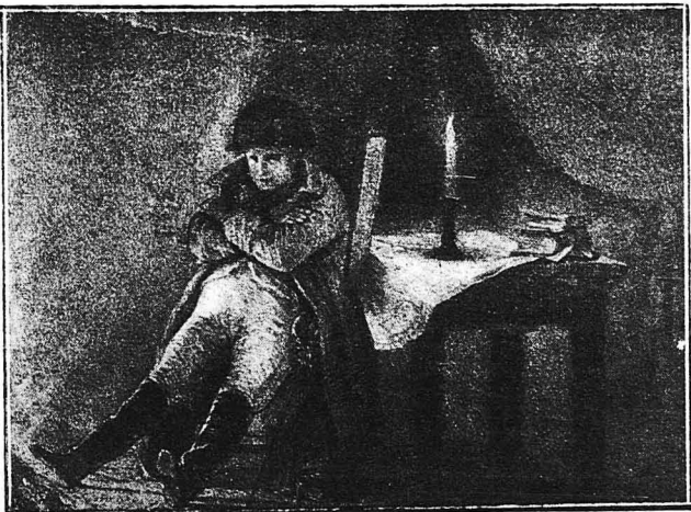
Μιά λιθογραφία τού Ραφφί, παριστάουσα τόν Ναπολέοντα άναπτόμενον την νύχτα, μέσα στή σπηγή του, κατά την διάρκεια τής έκστρατείας του στή Ρωσία.