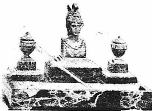
Τò καλαμάρι πού χρησιμοποίησε ο Ναπολέων, στην ‘Αγία ‘Ελένη ως έξόριστος.

Θέλατε νά μάθετε πόσο τόν άπασχολούσε ή εργασία του; Μιά μέρα, ο Ναπολέων καθώς έπαυσε νά βρη μιά σημείωση την όποια ήθελε νά δειξ ή σε ύ.απαιον ύπουργό του, είδε τυχαίως μιά μισοτελειωμένη έπιστολή τού Μενεβάλ πός τή συζύγο του: ‘Αγαπητή μου φίλη, της έγραφε, τριαντάξέξ ώρες πάρα, δέν άφηνα ού.ε στιγμή τού γραφείου τού αυτοκράτορος... Αυτό τò γράμμα όμως δέν συνεκίνησε δίλου τού Ναπολέοντος: ‘Βλέπετε, είπε στον ύπουργό του, προσφάντι κ’ ι.γάρεις έρωικά γράμματα στη γυναίκα σου. Καί όμως, παραπονείται πως δουλεύει πολύ! ‘Ο δυ τυχημένος Μενεβάλ δέν είχε ού.ε στιγμή άναπαύσεως: όπου κ’ αν βρισκόταν με τόν κύριο του ή δουλειά ήταν ή ίδια. ‘Ιδού τι γράφει ο ίδιος: ‘Ατι επάγγελμα κ’ αυτό τού αυτοκράτορος! ‘Οσο για μένα, εργάζομαι χθές με τόν αυτοκράτορα χωρίς διακοπή