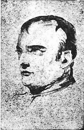
Ο Μέγας Ναπολέων

‘Η άναρχία στη Γαλλία. ‘Η νεότης του Ναπολέοντος. Σί μελέτε; του. ‘Η έκτασις της Γαλλικής Αυτοκρατορίας. Τò γράφιόν του Ναπολέοντος. Οί γραμματείς του. Τά μαρτυρία του. Τί τραβούσε ο βαρώνος Μενεβάλ. Μία ημέρα του Αυτοκράτορος. Τά καταναγκαστικά έργα. Οί άγρυπνίες του Αυτοκράτορος. ‘Υπό την σκηνήν. Στις έκστρατείες κλπ. κλπ