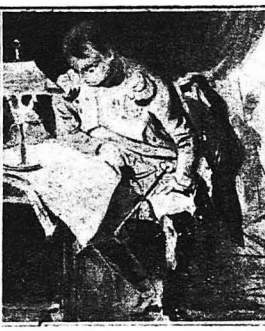
Στις έκστρατείες του ο Ναπολέων περνούσε τις νύχτες του διαβάζοντας τις άναφορές τών ύποουργών και τών στρατάρχων τού μελετώντας τους χάρτες γά να παρασκευάζε τις έπιχειρήσεις της έπομής.