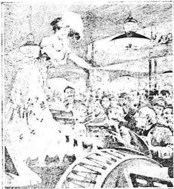
— Ἐκεῖνος, π' ἀγαπᾷ εἶν' ὁ Γκρανκασιέρης !.