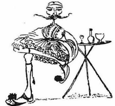
Μετὰ τῆς πρώτης Ἑλληνικῆς ἀρχῆς

Στὸ τέλος ὄλοι ἐζητωκραύνασαν ὑπὲρ τοῦ ἔθνους, τοῦ στρατοῦ, τοῦ κύρ ἐπιλοχία καὶ τοῦ Οἰκονομικοῦ Ἐφόρου πού ἔστειλε τὰ νέα τὰ χωριά.