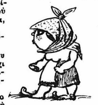
Ἡ ὑπεραφὸς καὶ εὐνοδὴς Σουσουλλκας.

Τότε ὁ Φαγανὰς εἶπε κ' αὐτὸς ἔνα ἔθιμο «σοσσοδὸ» πού γίνεσται στὴ Θεσσαλία καὶ στὴ Μακεδονία «ἀκαξέπισσαν». Εἶπε δηλαδὴ, ὅτι ὄσο νὰ βροῦν τὸ φλουρι τῆς πῆτας στὴ