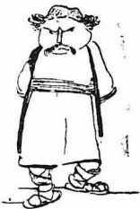
Ὁ Πρόεδρος Βουλκόβου ἔπηγε νὰ συνεννοηθῇ..

«Πρὸς ἀνάθωσιν τοῦ καταπολεπούμενου Ἐθνικοῦ φρονήματος εἰς τὰς Νέας Χώρας, δέον εἶναι νὰ πανηγυρίζονται μετὰ ἐξαιρετικῆς λαμπρότητος καὶ ἐπιδεικτικότητος. Αἱ ἀρμόδιαι κοινότητες ἐντέλλονται ὅπως εἰς τοὺς προδεδουλευμένους τὰν ἐγγεγραφένων ἰδιαιτέρων κοινόβλια, ἰσοδύναμα, πρὸς τὸ ἐξαιρετικὸν τῶν περιστάσεων καὶ τῆς μεγαλοπρεπείας τῶν ἐορτῶν, τὰ ὅποια κοινόβλια, ἐντέλλονται οἱ κατὰ τόπους Νομάρχαι ὅπως συγκρίνουν».