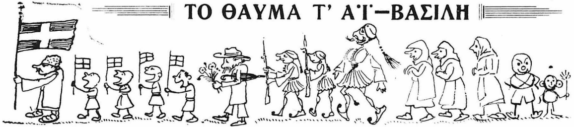
(Πρωτοχρονιάτικο ευζωνικό διήγημα)

Τὸ Ὑπουργεῖον τῶν Ἐσωτερικῶν εἶχε διατάξει :