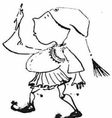
— Ἐγνοῖα σ' κύρ 'πιλοχία ;