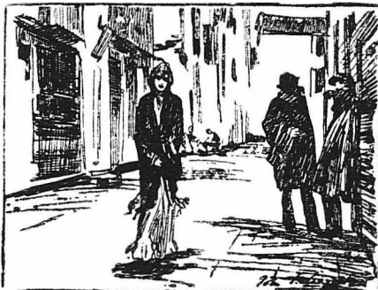
Περ.πληρηθικη άσκοπα μέωα στους δρόμους.

"Ενωθε μιιά μεγάλη κούραση σ' όλο της το κορμί και δεν είχε πεία τη δύναμη να παρακαλεση "Ηθελε να κοιη'η, να κοιμη'η όλη κληρα μερονυχτα, ρυθι πιένη σ' ένα' άτέλειωτον ύπνο. "Από μιιά βδ'μάδα δπου ζητούσε να μη τι ητρήτερα, παντού την έλια άπαντη εν τή; έδιναν σ' όλα τα σπίτια "Αν ήξερε κάποιο έταγγελημα, τότε τα πριματα θάειν άλλως και δέ θα κινδύνευε να πεθάνη από την πείνα. Τώρα όμως, ενώ στην άρχη δέχονταν να την παρονοσιν στην όλη ιουσα τους, μόλις έββεπαν το μικρό στην άγκαλιά της την έιωχαν άλιλοτε με βροσιές κι' άλλοτε με συμπονια... Χαμογέλασε πικρά και βγήκε. Στο δρόμο περιπατούσε στην τύχη, ενώ ή νύχτα έπαφει γύρω της άργά. Τα ή εκτροικά άρχισαν ν' άναβουν δια μαζί και τα παράθωρα να φωτίζωνται ένι-ένα. "Η φτωχή μη'ερα προχωρούσε δλότιο μπροστά της χωρίς καμια σκέψη, χωρίς καμια έλπίδα. Διχώς να ξέρη πώς, καθώς έβόδιζε άσκοπα, βρεθηκε άξυφνα στην προκουμιά. "Ανάμεσα από τις σκοτεινές όχθες του ό Σηκυονάας κελούθεν άργά, σκορπίζοντας γύρω του ένα μουμουρητό και μιιά μικρολένη φροσάδα. "Ο ποταμός την έβρεχε σά μαγνήτης σιά μυτικιά του βάρη, σά να τή; έλεγε ότι έκει μέωα μπορούσε να βρη'η τον ήπνο, την γαλήνη και την αιωνία άνάπαυση.