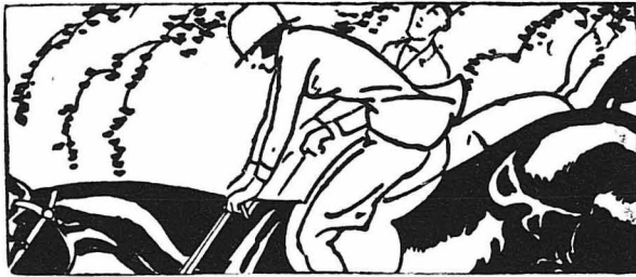
ΤΑ ΠΕΡΙΕΡΓΑ ΤΗΣ ΦΥΣΕΩΣ