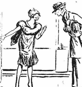
— Περάστε στο σαλονάκι, άγαπητέ μου κύριε.