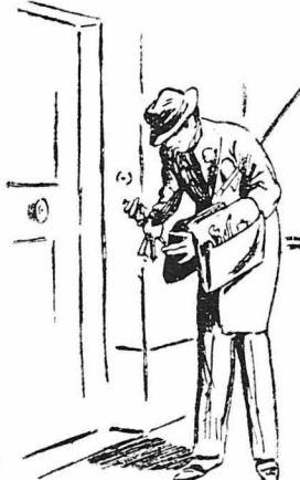
«Έβγαλε μιάν τσαντίτσα με όλα τά χρειώδη.

«Ο κ. Γκριέμπ δέν έβίασε τότε καθόλου. «Ο συζυγός θα γυρνούσε ό λίγο και τότε θα άπεκάλυπτε τις είνε ήταν, θα φώναζαν την άστυνερία και θα τόν πήγαιναν μέσα. Έβλεπε άμέσως τό χρεί του στην άριστέρη τσέπη της ρεντιγκότας του, έβγαλε τό πορτοφόλι του, πήρε ένα χιλιάριο — τό όποιο τό είχε κερδίσει με πούλό κόπο και άγανία — και χαμογελώντας δήθεν άδιάφορα, τό έδωσε στην κυ