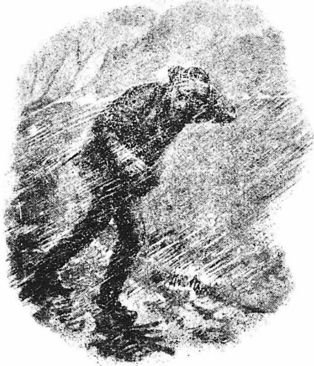
'Αμέσως έτρεξα, άνέβηκα σι' άλόγ μου...

— Αυτό τó πρόβημα είνε στρωγγυλότερο κι' άπό τόν κύκλο τού Γκιόττο ακόμη !