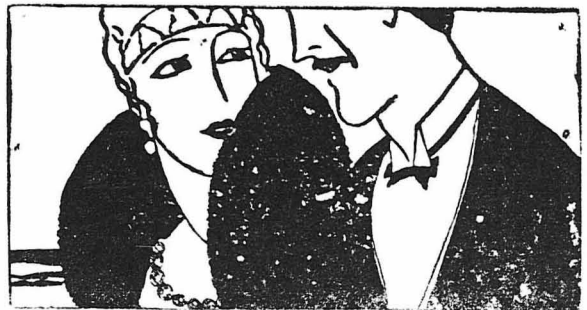
ΑΠΟ ΤΗΝ ΑΡΧΑΙΑΝ ΡΩΜΗΝ