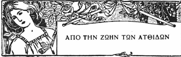
ΑΠΟ ΤΗΝ ΖΩΗΝ ΤΩΝ ΑΤΘΙΔΩΝ