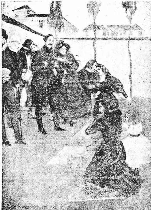
Κάθε χρόνο, οι οικογένειες των θυμάτων της Έπαναστάσεως τελοϋσαν μνημόσυνα επί των τάφων των προσφιλών των.

Η μπόρα έντομεταξύ διπλασιάζει την όρημή της. Τό πρώτο κάρρο με δύσκολία προχωρεί. Οι όχθώ γυναίκες πού βρισκονται επάνω, καθώς έχουν χέ-