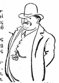
Χαράστρη πού'δω τόν πάρη.