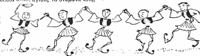
Τί δόξες και τί γλέντια πού είχε ίδει τό Μοναστήρι άλλοτε !