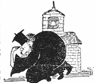
Εύλόγησον πάτερ !