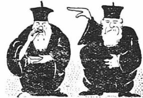
Μακράν άφ' ήμών οι πειρασμοί.

Παλητό Μοναστήρι και δοξασμένο άπό κείνον τόν καιό... Με αύτοκρατορικά χρυσοβουλα και παληές, παμνάλαεις εικόνες στούς τοίχους του.