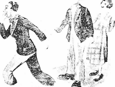
— Ἐνας τρελλός !...

Αὐτὸς εἶπόμε ἀκόμα δίδομοιο. Τὰ μάτια του σπιθοβολοῖσαν ἀγρια ! Ἦταν χλομοῦ, σὴν τὸ θεαίρι !... Τὸν μπῆσαε στὸ γραφεῖο καὶ προσπάθησαν νὰ μάθουν ἰ τοῦ συνέβηαιε. Μὰ ἡ κατάστασις του ἦταν τέτοια πὼς δὲν μποροῖσε νὰ μιλήσῃ καὶ νὰ ἐξηγηθῇ. Τραυλίξες, ἔλεγε διάφορος ἀστυκῆτοιος. — Τὸν κατάλαβα ἀπ' τὴν πρῶτὴ στιγμὴ πὼς τὸν ἐφρασαν, εἶπεν ὁ διεντυνῆς τῶν φυλακῶν. Καὶ σκῆβροτας οἱ αὐτὶ τοῦ ἐπὶ κεφαλῆς τῆς φρονοᾶς τοῦ φηδόντιος : — Εἶνε τρελλός ; ... Γιὰ δάμοιο !... (Ἄκολουθεῖ)