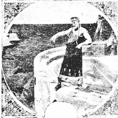
Ο θράνος της Σάμου Πολυκράτης εΐπουν το δαχτυλίδι του στη θάλασσα.—(Εικόν του ντό Μόντ)

Όμως στο λέω με πόνο, οά μητέρα, Όσο λαμπρό σου φαίνεται, δεν είνε Το δαχτυλίδι αυτό, χρυσό μου κείνε.