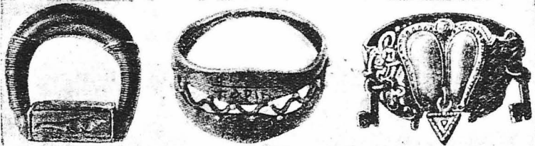
1. Δαχτυλίδι-σφραγίς του βασιλέως της Αιγύπτου.—2. Αρχαίο Έλληνικό δαχτυλίδι, σύμβολο της φίλης.—3. Γερμανικό δαχτυλίδι άραβώνων του 17ου αιώνα.

ήσαν έξαιρετικά πολύπλοκα. Κατασκευάζοντο πολύ πλατειά κ' έμοιαζαν με περιλαίμια σκύλων. Στη μέση τους έβρισκε ένα ροδοειδές κοσμήμα η ένα άστρο, έπάνω στο όποιο ήταν χαραγμένη η ελληνική έπιγραφή: «Ένωσις». Έπίσης στο ίδιο άστρο έπάνω ήταν χαραγμένα τέσσαρα πρόσωπα: Οί δύο σούζυγοι ειλογούμενοι από το Χριστό και την Παναγία. Το άλλο μέρος του δαχτυλιδιού ήταν