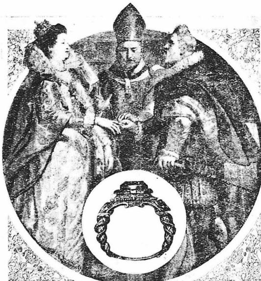
ΟΙ ΓΑΜΟΙ ΤΗΣ ΜΑΡΙΣΣ ΤΩΝ ΜΕΔΙΚΩΝ ΚΑΙ ΤΟΥ ΕΡΡΙΚΟΥ IV

(Έργο του Ρομπινς εΐρισκόμενο στο Μουσείο του Λούβρου) Ο Έρρικος IV δεν άπεικονίζεται στον πίνακα. Την θέση του την εχει ο θεός της Μαρίας των Μεδίκων Μάγας Δούξ Φερδινάνδος ο όποιος εν όνόματι του περνάει στο χέρι της πριγκηπίσσης το πατροπαράδοτο γαμήλιο δαχτυλίδι.