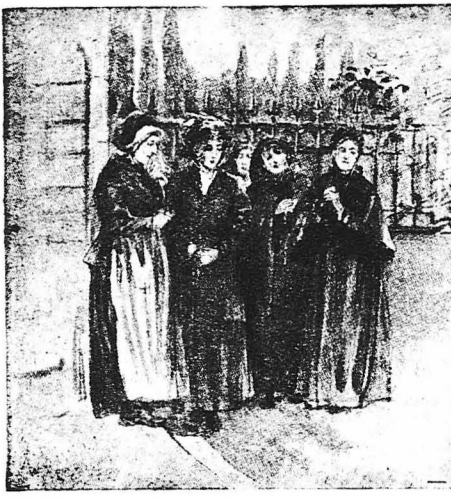
Στην εμφάνισή τους έπαυε κάθε κίνηση και άπλώθηκε νεκρική σιωπή...

Ο άνακριτής, βλέποντας την κατάπληξη του, έφώναξε: — Έλάτε!... Ήσυχάστε, κύριε Σαιντ-Όμπέν! Έδώ είμαι... Έλάτε και σεις! — Πού, κύριε άνακριτά; — Διάβολε! Στά κεραμίδια! — Λέν έπρόκειτο να συναντηθούμε στο Δημαρχείο; — Θά τό ποιμε καλύτερα δώ πάνω κύριε Σαιντ-Όμπέν! Δέν περιμένουμε πιά παρά μόνο έσάς! — Πώς; δέν περιμένετε πιά παρά μόνο έμένα; — Ακριβώς. Έλάτε γρήγορα. Μπητε στο σπίτι και θά βρητε τον ένοματόρη που θά σάς οδηγήση στη σοφίτα και από τό φεγγίτη στα κεραμίδια.