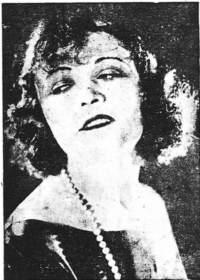
Η Πόλα Νέγκρι

ΣΗΜ. «ΜΠΟΥΚΕΤΟΥ»: Στά λόγια όμως αυτού τού Σαρλώ θα μπορούσε κανείς ν' άπαντήση κάλιστα: « Δέν τά περτάς με κούμεις Τσούφι... Άνεις καρδιές έκαρες κ' ή άρεντιά σου!... »