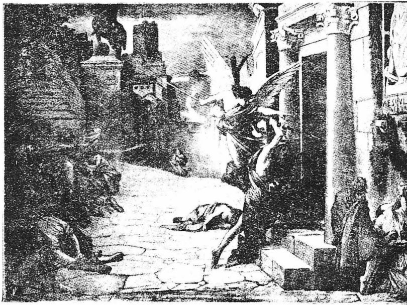
Η ΠΑΝΩΛΗΣ ΣΤΗ ΡΩΜΗ (Έργο του Ντελσαϊ)

Οι άσθενείσ πέθαναν σωριασμένοί ο ένασ άπάνω στον άλλο, μέσα στίσ έκκλησιέσ και γύρω από τίς βρύσεσ, όπου μαζεύοντουσαν για να ορβύσουσ τη φλόγα τουσ. Μέσα στούσ δρόμουσ τεράστιεσ φωτιέσ ήταν άναμμένεσ, στίσ όποίεσ έκαίγοντο τά πτώματα των νεκρών.