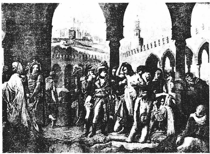
ΟΙ ΠΑΝΩΛΩΒΑΝΤΟΙ ΤΗΣ ΓΙΑΦΦΑΣ (Πίναξ του ζωγράφου Κρός) Κατά την έκστρατεία του Ναπολέοντος στην Αίγυπτο (1800) ή πανώλης ενέσκηψε επί των νικηφόρων Γαλλικών στρατευμάτων του. Ο Ναπολέων για να άνταρρήνη, τα στρατεύματά του, έπισκέπτεται τους ασθενείς και άγγίζει τους ροβήδους των. Πίσω άπ' το Ναπολέοντα φαίνεται ο χειρουργός Μασσελέ, ο όποιος προσβλήθηκε έκείνη τη στιγμή άπο την τρομερή άρρώστεια, συγκρατώντας τις δυνάμεις του για να συγκρατήθ.