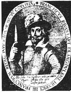
Ο βασιλοκτόνος Ραβαγιακ.

Τούς φορές τή κατάφερε να πλησιάση τόν Έρρίκο, άπ' τή μέρα που έναγατίσος τόν πόδι του στί Παρίσι ο Ραβαγιακ. Οι έπασιπιοί τού βασιλέως όμως τόν βρομιάσθησαν και τόν σνέλασαν ως ύποπτο, μά ο Έρρίκος διάταξε την άπόλυσή του. Ο Ραβαγιακ άπελειωμένος άπ' τίς άποτυχίες τών άποράσεω για πάη και τή Ζηηγή συμβουλές για τή σχέδιό του από μερικούς φίλους τών κληρικών, οι όποιοι όμως μόνος τόν άκοσων τού ελπαν πως όσα σκεπάζεται είναι έξοφρονικά. Τα σσηή αυτά λόγια δέν έπιασαν τόν Ραβαγιακ, ο όποιος είχε μέσα τού βαθιά ομωμένη την πεποίθηση πως ήταν άνώτερος άνθρώπος και πως ο προσομής του ήταε σ' άταλλάξη την καθολική εκκλησία και τόν πάπα από τόν επικίνδυνο έθρόνο τού Έρρίκο Α'. Άπεσπώσθη σνεκώς εκ νέον τή πλησιάση τού βασιλέα και τή τόν σκούσση. Δέν τόν κατόφισος και πάλη, άπειπίστικη κ' έβγαξε για τόν χωριό του. Οι κληρικοί της Άγγουλέμης δέν τούσαν καθόλου καλή βουδοχή μόνος έγθασε εκεί. Πριν γύρει για τόν Παρίσι, τούς είχε ύποσθεθεί πως θα σκούσση τόν Έρρίκο... μά δέν εκούτησε τόν λόγο του!... Η έπισορία τών έξώρωσος τούς καθολικούς ομπατισμένους του, οι όποιοι εξήρτησαν