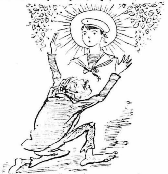
Μὰ ξάρνον ἕνα φάντασμα μπρὸς τοῦ βρίζεται.