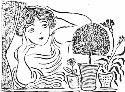
Πῶς ἀπὸ τοὺς βασιλικούς κι' ἀπὸ τὰ δροσμοαῖνα.

* Ἀραδιαστά ἔχονται τὰ ποτήρια. Ρουφάει καὶ ὅλο ρουφάει, σὰν ὁ διασημένος, σὰν ὁ φλογισμένος κάμπος, τὴ δροσιά. Κι' ὅλο οἶζει στὸ γεμάτο το ποτήρι, τὰ θολωμένα μάτια του. Καὶ πάλι, ἀπὸ τὸ βαθύκοκκινο, τὸν ἀχτιδοστὸ λίσιο το βυθό, ἄλλοι κόσμοι βγαίνουν καὶ ξεπετιώνται στὴ μνήμη του.