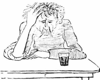
— Κάπελλα, κρασί!