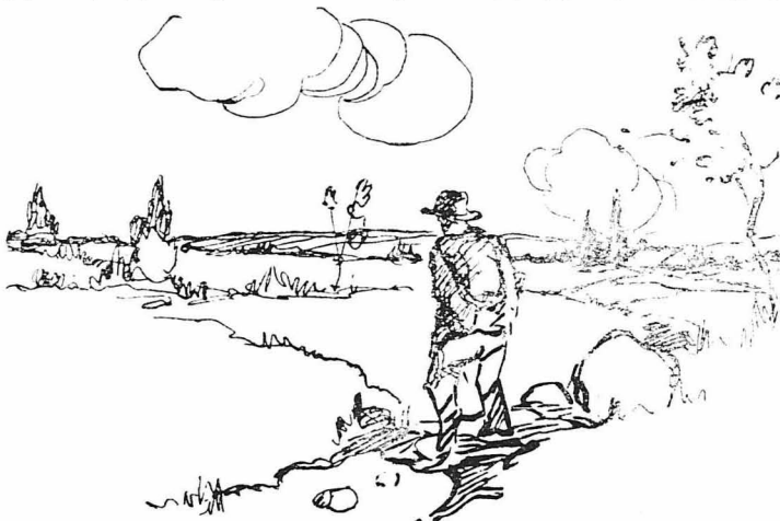
Βήγκα στὴν ἔξοχη...