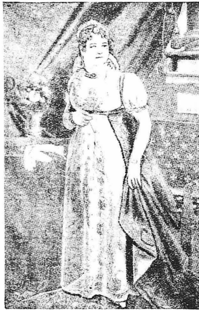
‘Η στρατηγίνα Λεφέβρ. (Κυρία Δεν-Με-Μέλλει)

Έτσι, σιγά σιγά, ή βασιλική εϋνοια περιέβαλε και πάλι τό Λε-