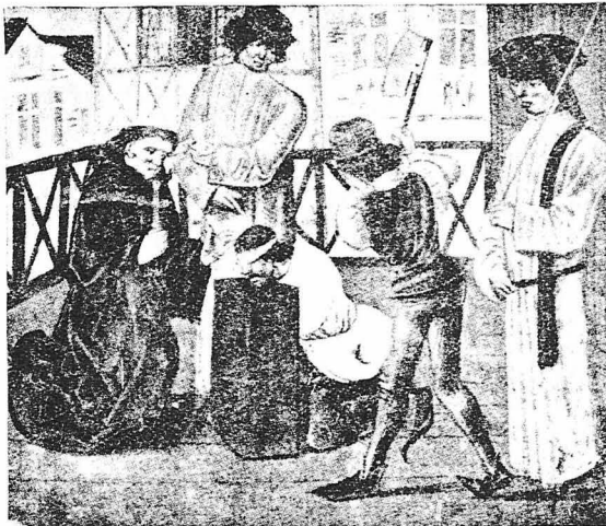
ΒΑΝΑΤΙΚΗ ΕΚΤΕΛΕΣΙΣ ΣΤΗ ΓΑΛΛΙΑ ΚΑΤΑ ΤΟΝ ΜΕΣΑΙΩΝΑ

Στὴν ὁδὸ ντὲ Μπελζαινού 39, σὲ Παρίσι, ἕνα ὄμοιοτατο ἐλβετικὸ σπίτι νὰ ἐξοχόιζε πρὸ ὀλίγων ἀτόμων χρόνων, μὲς ἄπ' τὰ ὀλάνθισια δέντρα ἐνὸς κήπου. Μὲς ἄπ' τὰ φυλῶματα, ὁ ἴλιος ἔριχνε τὶς ἀχτίνες του ἀπάνω σὲ τὸ σπίτι : Πλάι στὴν πόρτα τῆς εἰσόδου, μὲ ὑπεροχὴ μεγάλῃ ἀκακία ἔριχνε κατὸν τὸν ἴσκιό της. Βλέποντας κανεὶς τὸ σπίτι αὐτὸ θὰ τὸ ἔπιανε ὅς τὸ ἐρημητήριο κανόνος φιλοσοφοῦ ἢ ποιητοῦ. Καὶ ὅμοιος ἦταν τὸ σπίτι τοῦ δῆμοιου Μπελκίντεν, ὁ ὁποῖος ὑπῆρξε ὁ τελευταῖος τὸν Γάλλων δῆμοιου.