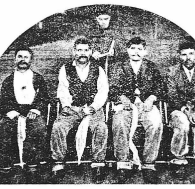
ΠΡΟ ΤΗΣ ΕΚΤΕΛΕΣΕΩΣ