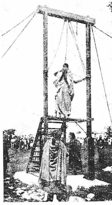
ΕΠΙ ΤΗΣ ΑΓΧΩΝΗΣ: Η ΤΕΛΕΥΤΑΙΕΣ ΣΤΙΓΜΕΣ ΕΝΟΣ ΚΑΤΑΔΙΚΟΥ

Τὸ πρωί, πριν ακόμα ξεμερώση, από τις τρέεις και μισή, βρισκόταν και πάλι στο μεγάλο τών Δικαστηρίων. Η τουαλέτα του ήταν έντελώς άωρη: Φορούσε ψηλό καπέλλο, βαλμένο στραβά κατά την άγγλική μόδα, τὰ μαλλιά του τὰ είχε