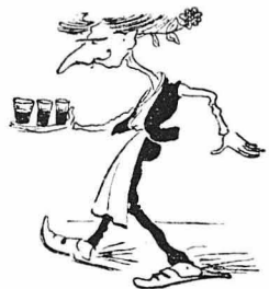
— Ο Νταής - Κώστας έφρυνε σαλιτωχο κοκκινέλι.