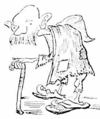
— Δύο-τρία χρόνια έσοφθήκαμε.