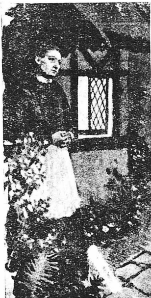
Έξωρε ήουρα τις βόλονταις ήμους της ζωής της.

‘Ετσι έκλεισαν την κυρία Παννεντελί στο πλησιέστερο φρενο-