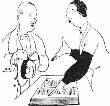
Ο Υπάλληλος : "Ηθελε και τό πήρε ένας αξιοσεβαστος κύριος...

Ο ΑΞΙΟΣΕΒΑΣΤΟΣ ΚΥΡΙΟΣ, (βγαίνοντας νά πληρώσει τόν καφέ του).— Νά, πάρε και τρεις δεκάρες διζές σου. (Φεύγει).