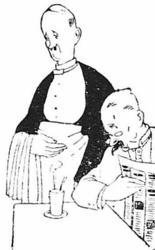
Ο αξιοσεβαστος κύριος : "Υπάρχουν άζόμια πολλοί τίμιοι άνθρωποι στον κόσμο !...