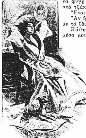
— Θεέ μου πόσα χτυποκάρδια !...