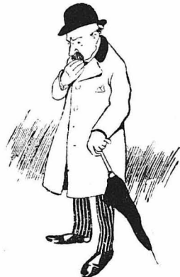
Έτσι ο Λαργζάκ ξαναγύρισε στην έρημιά του...