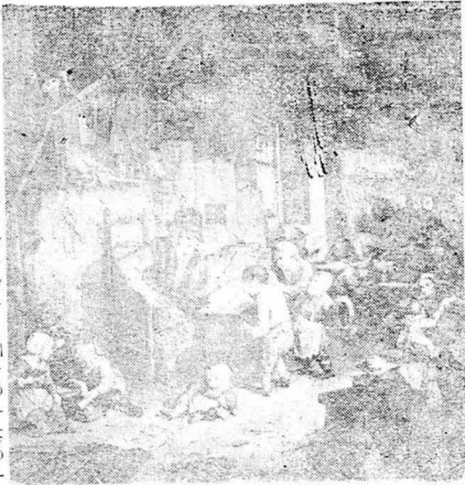
ΕΝΑ ΣΧΟΛΕΙΟ ΣΕ ΣΑΛΑΝΔΙΚΗΣ ΧΩΡΙΣ ΚΑΤΑ ΤΟΝ 15ον ΑΙΩΝΑ

Όστόσο στην Άγγλία, τόν πολιτισμό της όποιος δέν μπορεί κανείς ν' άρνηθη, και στα μεγαλύτερα άκόμη σχολεία, σε λύκεια διεθνούς κύρους, όπως τό Κολλέγιον του Ήτον, οι μαθητάί, όταν ύποπίπτουν σε παραπτώματα, ύποβάλλονται σε σκληρότατες τιμωρίες, άνάλογες προς τις μεσαιωνικές τις όποιες άναφέραμε παραπάνω.