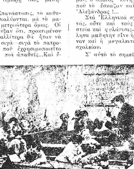
ΕΝΑ ΣΥΓΧΡΟΝΟ ΣΧΟΛΕΙΟ (Πίναξ του Ζερφρούα)