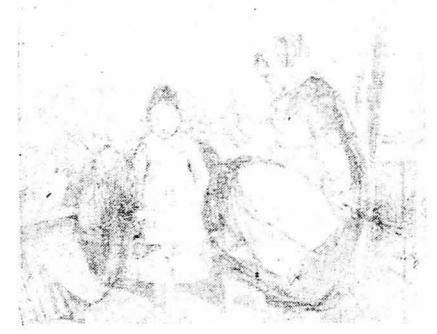
Η ΚΥΡΑ ΖΑΣΚΑΛΑ (Παλιά ληθογραφία) Η μικρότατη μαθήτρια στέκεται φοβισμένη από τις βέργες που κρατούσε ή δασκάλα της.