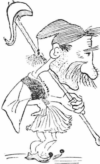
Με έόπη εκατέβηκε άπ' τό χωριό τον στην Αθήνα.