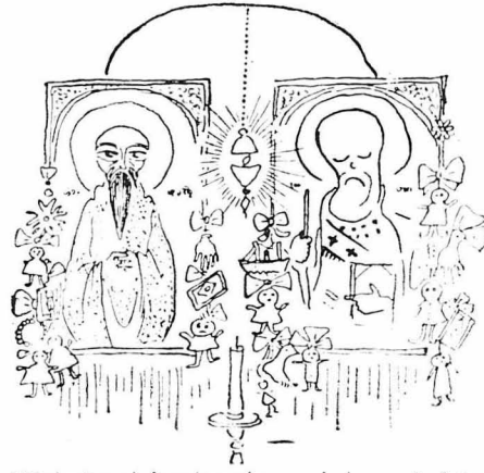
Έντοκαζαν τα άσημένα τάμματα απάνω στους αγίους.