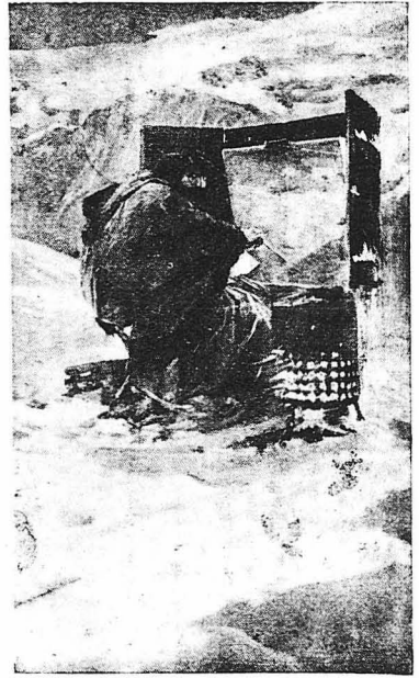
Ο Σεγκαντίνι ζωγραφίζων τόν τελευταίο του πίνακα έπάνω στην χιονισμένη κορυφή τού Σαμπετέργκ.

Ένα βράδυ τού Σεπτεμβρίου ό Σεγκαντίνι ζωγράφιζε στην κορυφή τών Άλπεων Σαμπετέργκ ένα μερικό πίνακα τόν όποιο ήθελε νά στείλη στή Διεθνή Έκθεση τών Παρισίων τού 1900. Δέν είχε ούτε νερό κ' αναγκαζόταν νά λιώνη χιόνι γιά νά πιη. Έξασμα ένας πόνος τόν έπιασε. Ο μικρός βροσός πού τόν συνόδευε έστρεξε προς την κοιλάδα γιά νά ζητήση βοήθεια. Μά όταν, ύστερ' από μιá έπικίνδυνη άνάβαση, έφτασαν οί γιαντροί, ήταν πολύ άσρά... Ο μέγας ζωγράφος είχε πεθάνη από όξεια τυφλί-