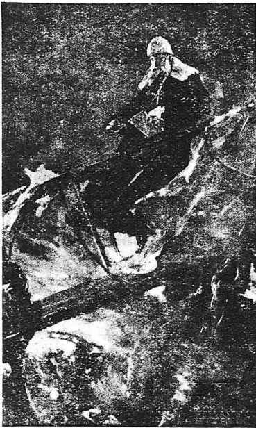
Η ΤΕΛΕΥΤΑΙΑΣ ΣΠΙΓΜΕΣ ΤΟΥ ΖΩΓΡΑΦΟΥ ΒΕΡΕΤΣΑΓΚΙΝ ΕΠΙ ΤΗΣ ΓΕΦΥΡΑΣ ΤΟΥ «ΠΕΤΡΟΠΑΒΛΟΣΚ» "Ο μέγας καλλιτέχνης, τή στιγμή που τό θωρηχτό βυθίζεταν σχεδίαζε άκόμη.

Τό ναυάγιο τής ναυαρχίδος «Πετροπαβλόσκ». Ο μέγας ζωγράφος Βερετσαγκίν που πνίγηκε ζωγραφίζοντας. Οι ζωγράφοι στον πόλεμο. Τά θύματα τής τέχνης των. Η ζωή του Βερετσαγκίν. Ζωγράφος στην έρημο! Οι ζωγράφοι του μεσαίωνα. Ο «Περσέυς» του Μπενβενούτο Τσελλίνι. Στους παγετώνας τών Άλπεων. Ο θάνατος του Σεγκαντίνι κτλ.