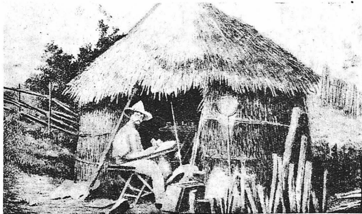
ΣΤΑ ΧΩΡΑ ΤΟΥ ΠΥΡΕΤΟΥ ΚΑΙ ΤΗΣ ΔΙΨΑΣ