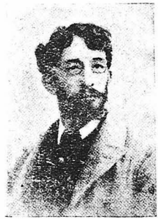
Ο Γάλλος ζωγράφος Πότερ που σκοτώθηκε στην Αίθιοπία.

Μά και πρό αυτών πολλοί άλλοι ένοιωσαν τήν ίδια περιφρόνηση προς τους κινδύνους και τό θάνατο. Κατά τό 1854 ό Άγγλος ζωγράφος Χόλμαν Χούντ ζωγράφιζε ένα πίνακά του στον όζυθες τής Νεκράς Θαλάσσης κρατώντας τό καπέλλο του στό ένα χέρι και μιά καλή καρμπίνα στό άλλο γιά ν' άμύνεται κατά τών άράβων ληστών που τριγύριζαν άδιακοπα στά