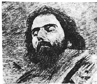
Ο Σεγκαντίνι νερός. Στίλνισ τού Γουαζέτινι