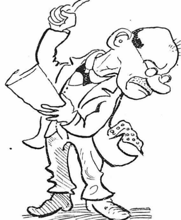
"Ο δόξαλος του χωριού το έξηρθε."

"Ό δόξαλος του χωριού, που έτυχε, να είναι «παρών», οάρ ήθελε ή διαταγή γιατί είχε και τα τηλεφώνια και τα ταχυδρομεία της προηγούμενης, το έξηρθε..."