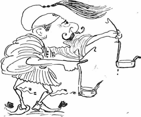
- Φάτο, μοροέ, σοδ λέω!"