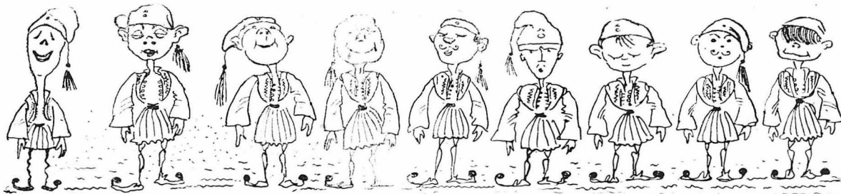
"Όλοι οι άνδρες στη γραμμή!"