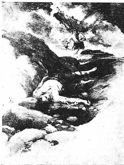
ΣΙΣΜΕΝΟΙ ΑΠΟ ΕΝΑ ΠΤΩΜΑ!...

Τὸ ἱστοφόρο «Φινάνξ» ἐναυαγίσθη. Τότε ἕνας ναύτης δένοντας ἕνα σκοινὶ στὴ μέση του, ἄρπασε τὰ κώματα καὶ κατώρθωσε, μακίνας, νὰ φτάσῃ στὴν ἀκτῆ. Κάνοντας μὰ τελευταία προσπάθει, σαρῶνεται σ' ἕνα βράχο κ' ἐνῶ αὐτὸς ἐξημέρωσε οἱ σύντροφοί του, πασιμένοι ἀπὸ τὸ τεντωμένον αὐτὸ σκοινί, ἀποβιβάζονται σὺν τῆν ἀκτῆ.