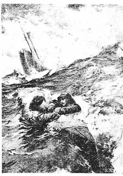
ΕΝΑ ΔΡΑΜΑ ΣΤΗ ΘΑΛΑΣΣΑ

Γαντζωμένοι από την καρίνα της άναποδογρισμένης τους βάρκας, οι δύο ψαράδες αγωνίζονται άπεγνωσμένως κατά τον κινάτο. Μα ο ένας έχει εγκαταλήθει πιά και εις έτοιμος ν' άφήρη την καρίνα. Τότε ο σύντροφος τον τον αρπάζει από τους καρπούς του χερσιού και τον κρατάει λέγοντός του ότι όσο άντίζει εκεινος, θα ζήση κι' αυτός !