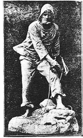
Το μνημείο που έχει αναγορθη στο Καλαί, εις μνήμη των ναυαγοσωτήρων που έπληγαν κατά την έκταλειν του καθήκοντός των (Έργον του γλύπτου Λοριέ.)

Η «Κεντρική Έταιρία» μισοεινά είναι παρήφανη για το έργο της. Μέχρι σήμερα άνω των 20.000 ναυαγών της χροστόνη τη ζωή τους και πλέον των 300 πλοίων τη διάσωση τους. Σε μιά μονάχα τριζυμία, τελευταίος, διεσώθησαν από τις οργανώσεις της 250 ναυαγοί. Οι άριθμοι αυτοί μιλούν με πολλή ευφράδεια για το μεγάλο της έργο. Ό ήρωισμός και ή ατοθυσία των ναυαγοσωτήρων της είναι άξια παντός έπαινου. Έντούτες αυτοί οι άπλοίοι άνθρωποι τά μεγάλα τους κατορθώματα θα θεωρούν σά μιά μικρή διασκέδαση στη μονότονη ζωή τους !