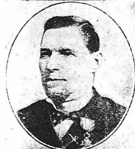
ΟΙ ΗΡΩΕΙΣ ΤΗΣ ΘΑΛΑΣΣΗΣ Ο διάσημος ναυαγοσωτή Λε Μα, ο όποιος έσωσε τά πληρώματα 99 πλοίων.