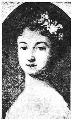
‘Η Άρτεμις του Ποατιέ. (Από παλαιά εικονογραφία)

‘Η άπαρηγόρητη χήρα. Γιά νά σώση τόν πατέρα της. Φίλη του Φραγκίσκου του Α΄ και του Έρρικου του Β΄. «Η ρυτιδωμένη γριά». Μάγια, βότανα, φίλτρα. Ξωραία και άνηρη στά έβδομηντα της χρένια.