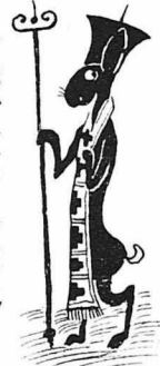
Λαγούς με πετραχειλία