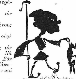
Πάου νά πουλήσου ένα λαγό.