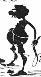
Είς τόν άνομοτάωχη κ. Σαραβαλιάν