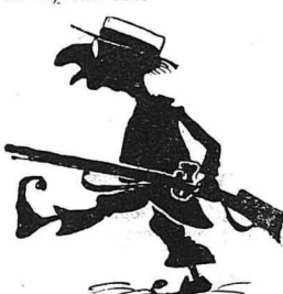
Σκυλλι μονάχο ήτανε ο δάσκαλος