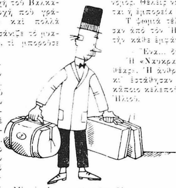
Με το νέο του κοστούμι θα παροσα-ζώνε ο Ήλιος στο χωριό του.