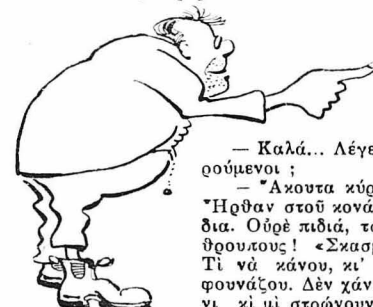
Τὴν ἐπεμβάσει τοῦ δικηγόρου τοῦ ὀρ- μιστήριε

— «...Νὰ εἶπω τὴν ἀλήθειαν, χωρὶς φόβον καὶ χωρὶς πάθος», τελειώνει ὁ Πρόεδρος.