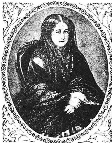
‘Η Αύτοκράτειρα Εύγενία.

[...‘Από τότε ο ‘Εμμ. Καλλέργης έζησε πάντοτε στην ‘Ελλάδα φερόντας μέσα στην καρδιά «τό όξύ και οδυνηρό βέλος του οδυνηρού έρωτός του». ‘Εγέμιζε τούς τοίχους τού δωματίου του με εικόνες τής