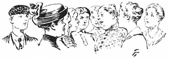
ΤΑ ΠΑΡΑΞΕΝΑ ΤΟΥ ΡΟΖΜΟΥ ΤΟΥΤΟΥ